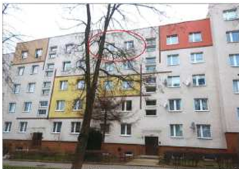
Ogólny widok wielorodzinnego budynku przy ulicy Bolesława Krzywoustego nr 2 - 2g. z zaznaczonym położeniem przedmiotowego lokalu.

na sprzedaż lokalu mieszkalnego Nr 49, znajdującego się w budynku położonym w Lubaniu przy ul. Bolesława Krzywoustego 2d (JG1L/00033482/2) wraz z udziałem we współwłasności nieruchomości gruntowej (działka nr 1/55, AM 15, Obręb II o powierzchni 6 793 m 2 , JG1L/00031564/7)